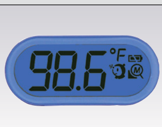
LED de fundo azul