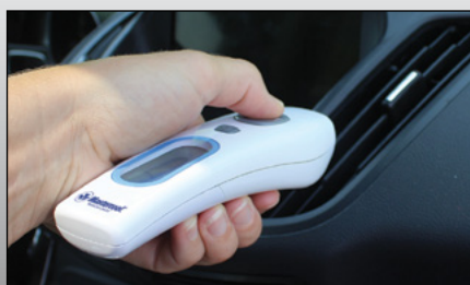
Modo de superfície